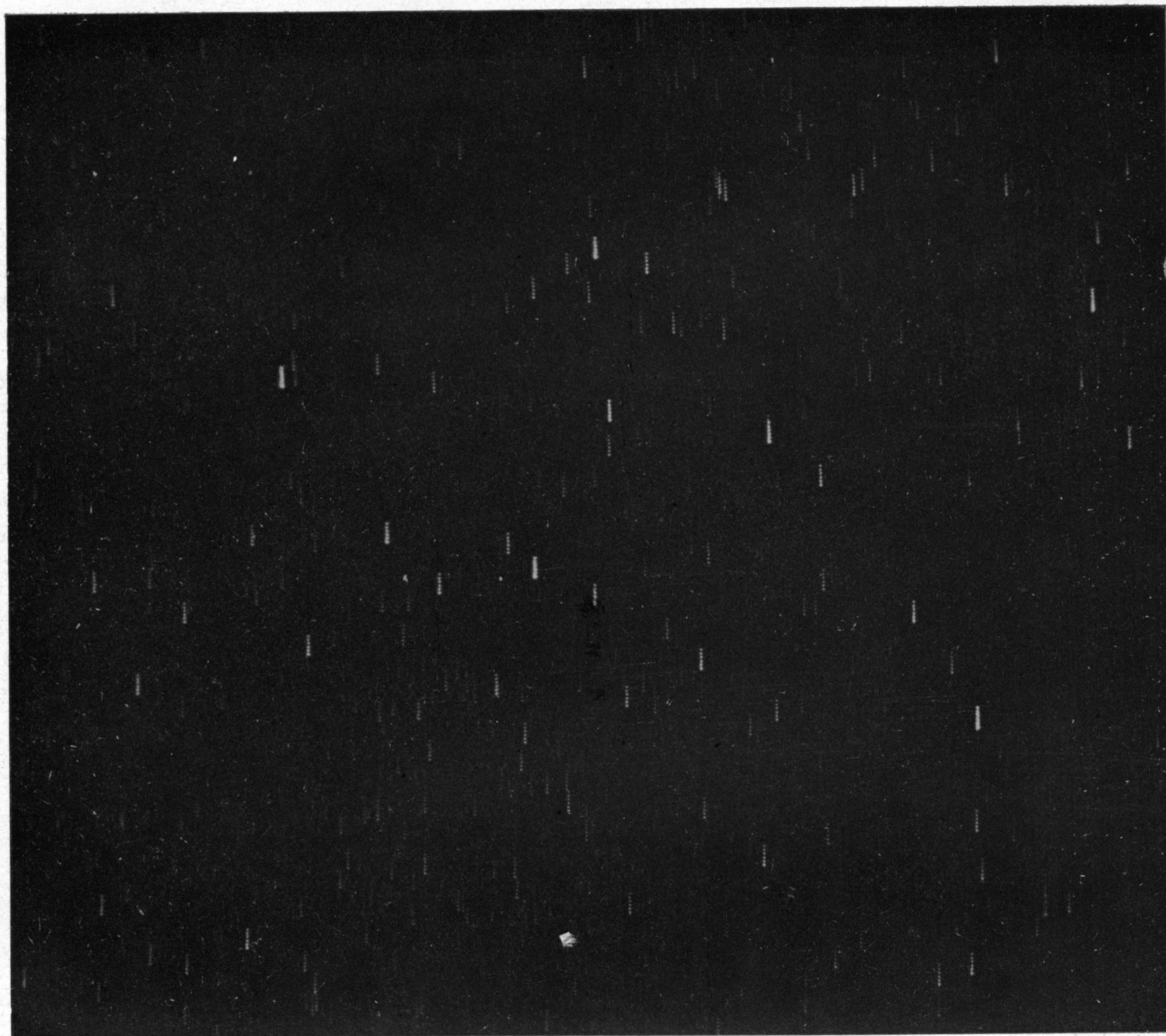
TAV. 1. - Zona della Nova C P Lacertae fotografata il 23 agosto 1936 con sei pose successive da 120 secondi ciascuna, con diaframmatura progressiva (scala 1^{\circ} = 13 mm).

G. de MOTTONI - Su di un procedimento di fotometria stellare fotografica.