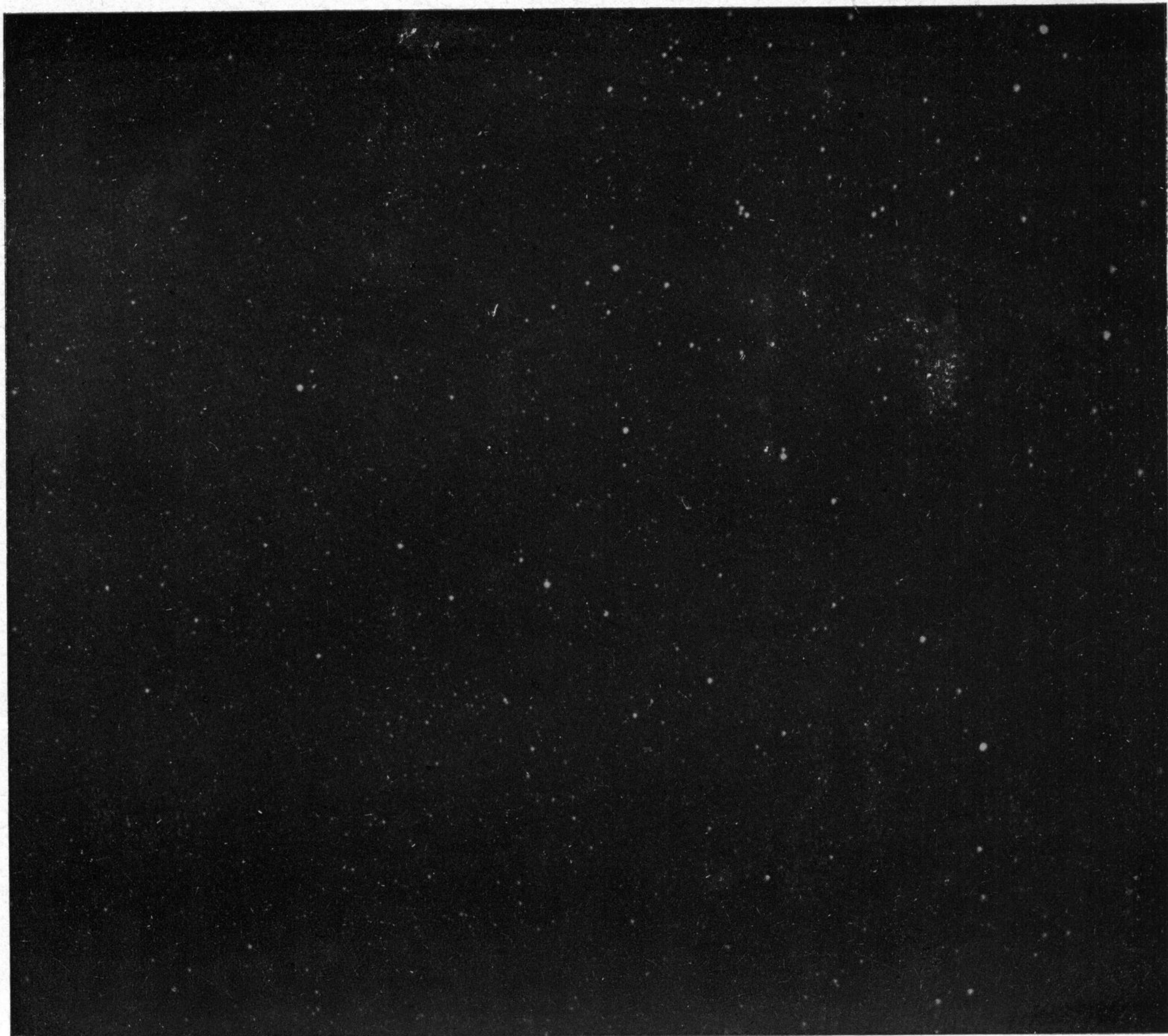
TAV. 2. - Zona della Nova CP Lacertæ fotografata il 25 agosto 1936 - posa 15 min.

G. de MOTTONI - Su di un procedimento di fotometria stellare fotografica.